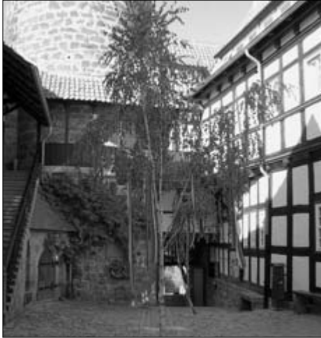
Pfingstmorgen im Burghof

andere, bekannte Gesicht wiederzusehen. Nur ein solches fand ich wieder, alle anderen Teilnehmer kannte ich nicht. Diese hatten ihre Fahrten in der Zeit erlebt, die ich nur aus Erzählungen oder alten Fahrtenberichten kannte. Doch sind ja gerade diese „Geschichte atmenden“ Erzählungen die besonders bewegenden. So fanden sich zwischen Rittersaal und Küche, Burgtor und Meißnerbau viele Möglichkeiten für Gespräche zwischen „dienstalten“ Ludwigsteinern und Neulingen dieser Vereinigung – ein Kennenlernen, das nicht bei der Frage „In welchem Bund bist Du?“ stehen blieb.