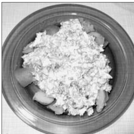
Grüne Sauce mit Pellkartoffeln

Als regionale Spezialität gibt es vor allem die „Frankfurter Grüne Sauce“ und die „Kasseler Grüne Sauce“, wobei jeder natürlich behauptet, seine sei die Originale. Auch international findet man „Grüne Saucen“ in Italien, Frankreich und den Kanarischen Inseln, wobei sich hauptsächlich der Name, aber weniger die Zutaten ähneln.