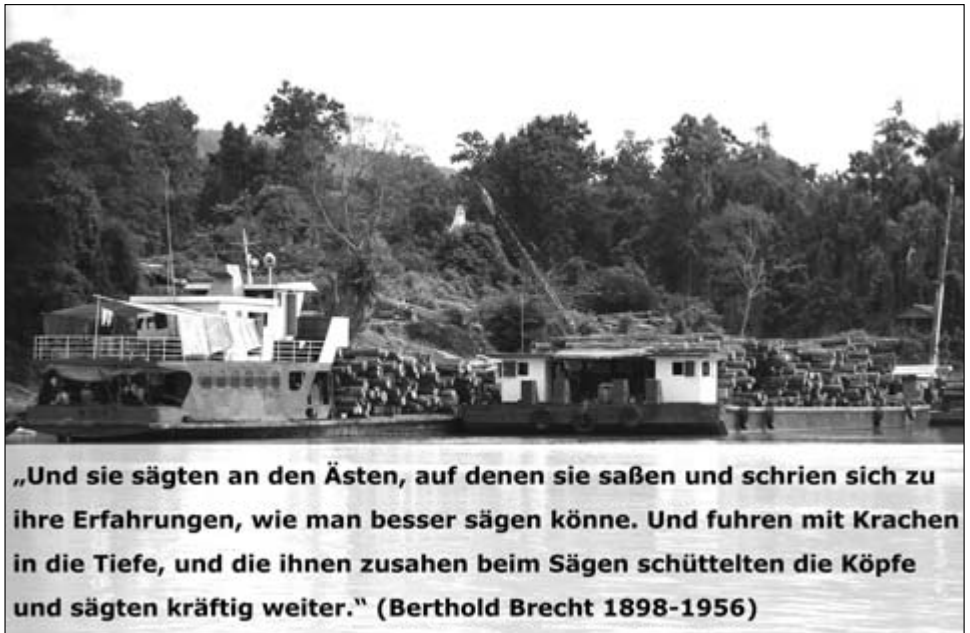
Sägen ohne Kopfschütteln? Verschiffung von Tropenholz am Fluss Irrawaddy in Birma

Wenn unser Energiehunger zudem aufgrund des verhältnismäßig großen Flächenbedarfs der Bioenergieproduktion zur Zerstörung naturnaher und natürlicher