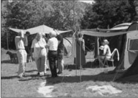
Die „alten“ Ludwigsteiner zu Besuch bei den Jungen Ludwigsteiner