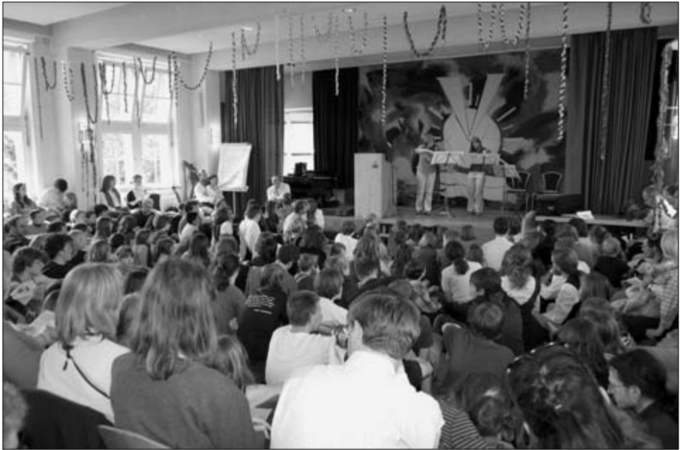
Festveranstaltung zum 50. Jubiläum der deutschen reform-jugend (drj)

Heute muss ich feststellen, dass ich gerade einmal 11 Jahre jünger bin als die drj. Wenn ich also über die Jahre 1985-1995 spreche, so spreche ich nicht über die alten, höchstens die mittleren Jahre