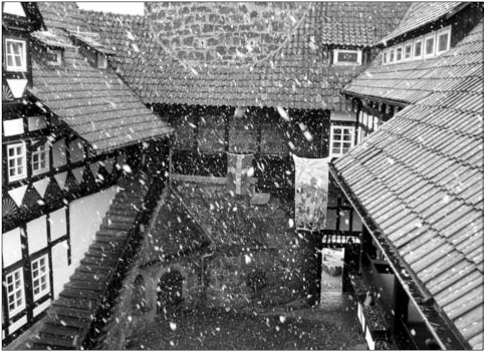
Dicke Flocken überzogen die Burg mit einer „Zuckerschicht“

Viele Deutsche stellen sich Schweden als ein sehr kaltes und schneereiches