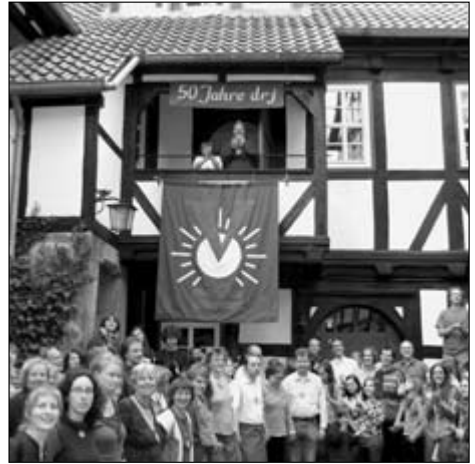
Singerunde im Burghof

Mit welcher Spannung haben wir nicht alle dann die Ereignisse der Wendejahre verfolgt. Und es war schnell klar, dass die drj davon nicht unberührt bleiben konnte. Und so eroberten wir die neuen Bundesländer auf dem Kirchentag in Berlin, auf der großen Sternwanderung Mitte-Süd 1990 im südlichen Thüringer Wald, auf dem symbolischen Weg vom Ludwigstein zum Hanstein, auf dem Bundeszeltlager 1992 in Brotterode, ebenfalls Thüringer Wald, auf Sommerzeltlagern in Brandenburg und an der Ostsee etc. Es war eine logische Konsequenz, dass bald auch ein Land Ost gegründet wurde, das einige Jahre lang recht munter vor sich hin werkelte.