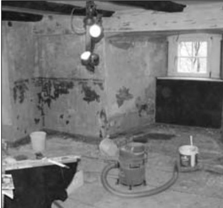
Die "entkernte" Südwest-Sitzecke

einschließlich der geschnitzten Vertäfelung der Sitznischen ausgeräumt und im Rittersaal zwischengelagert werden. Dabei erwies sich der große runde Tisch als besonders widerspenstig: die Platte passte knapp durch die Tür, das Untergestell musste drin bleiben und wurde, gut abgedeckt, als Arbeitsgestell genutzt.