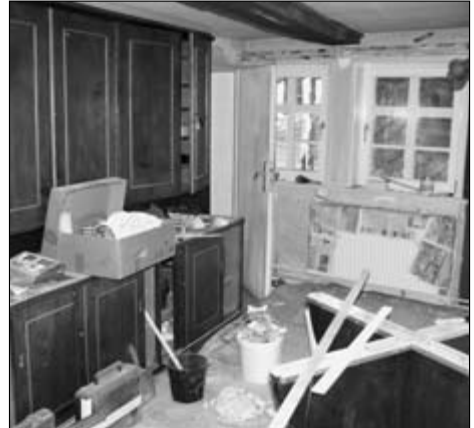
„demolition in progress“

Zum Schluss wurden über den Fensternischen und über dem Tisch neue Lampen montiert, die alten Strahler fanden in der Nische Verwendung.