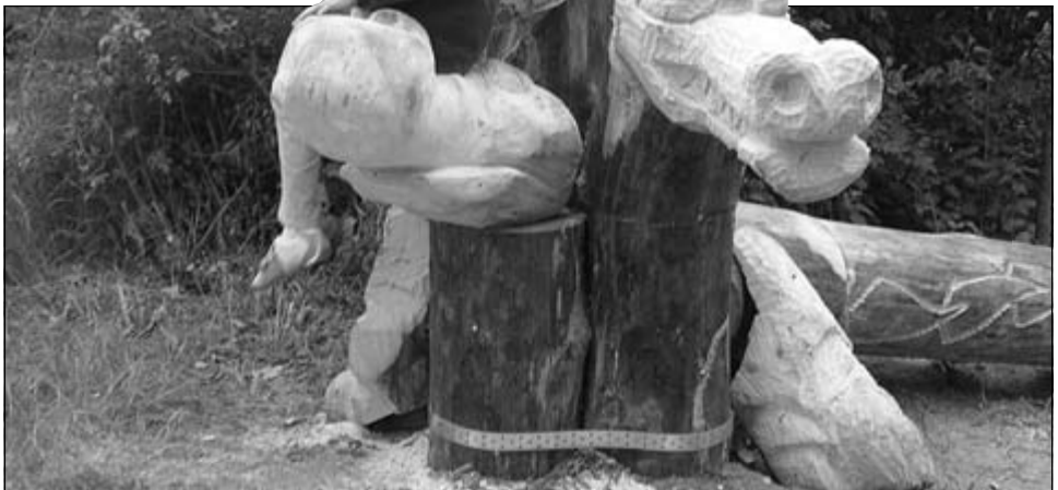
Eine mutige Drachenreiterin