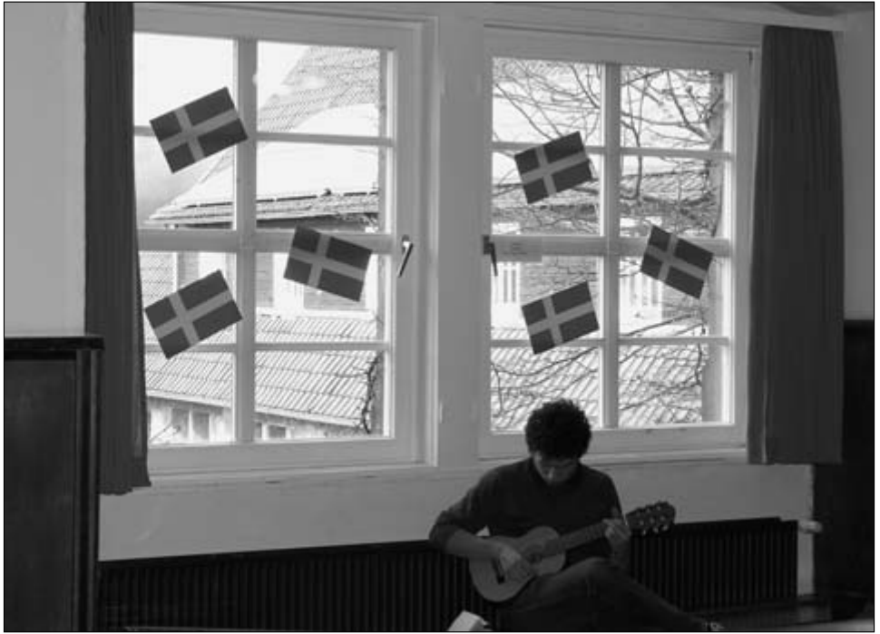
Die allgegenwärtigen Schwedenfahnen erinnerten stets an das Motto der Woche

auch das Jonglieren: Erst wurden eigene Jonglierbälle aus Luftballons mit Reisfüllung hergestellt, und anschließend probierte man sein Geschick im Meißnersaal, der dadurch gut gefüllt war. Angeleitet wurde der Kurs von einem Profi-Jongleur.