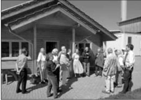
Begrüßung der Ludwigsteiner vor dem „Informationszentrum“