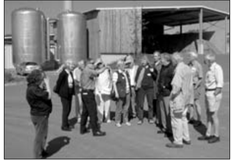
Die Ludwigsteiner vor dem Hackschnitzelkraftwerk

men entdeckten wir als erstes die große Waage. Dort werden die Hänger mit den Energiepflanzen für die Biomasse oder mit Gülle bei der Anlieferung durch die Bauern gewogen. Aus Spaß sind alle teilnehmenden Ludwigsteiner auf diese Waage gegangen, und so entstand der Titel dieses Beitrages.