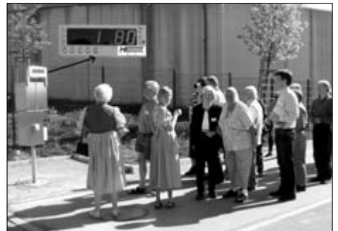
1,8 t Ludwigsteiner zu Besuch

Am Pfingstsonntag begann nach dem Frühstück unsere Exkursion zum Bioenergiedorf Jühnde. Wir fuhren zwar mit PKWs, aber in Fahrgemeinschaften. Auf dem Parkplatz in Jühnde angekom-