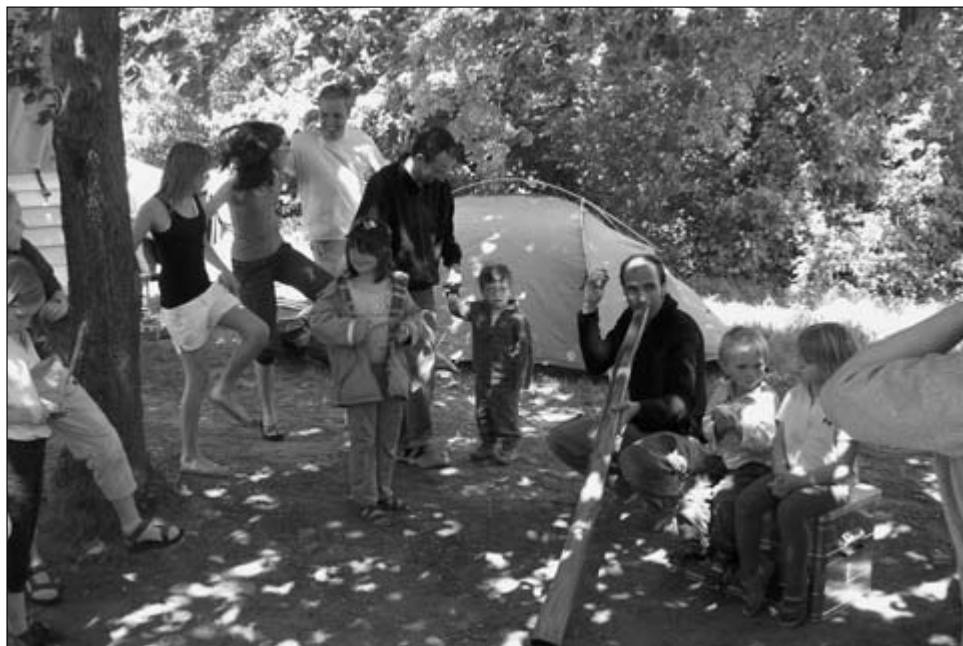
Junge Ludwigsteiner auf der Zelterwiese beim Spielen

Es war schon außergewöhnlich, sich schon am ersten Abend keine Gedanken