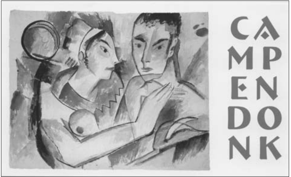
Heinrich Campendonk: Liebespaar, um 1912