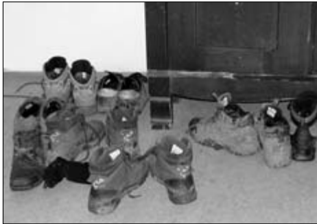
Die lehmigen Schuhe durften nicht aufs Zimmer!

Da Ostern dieses Jahr besonders früh war, hatten wir statt Kirschblüte fast jeden Tag Schneefall, also den Vorurteilen vieler Deutscher über Schweden entsprechend. Wenn die dicken Flocken längere Zeit vom Himmel fielen, bildete sich sogar eine Schneedecke von eini-