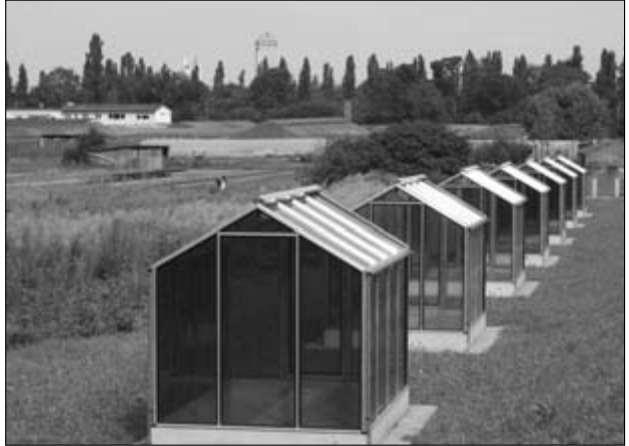
Denkmal für die Grüne Sauce

Die Kräuter der Frankfurter Grünen Sauce werden hauptsächlich im Stadtteil Frankfurt-Oberrad angebaut, wo sich sogar ein „Verein zum Schutz der Frankfurter Grünen Sauce“ gebildet hat. Ein Antrag bei der Europäischen Union auf eine geschützte Ursprungsbezeichnung (z. B. Allgäuer Bergkäse, Überkinger Mineralquellen, Altenburger Ziegenkäse) bzw. geschützte geographische Angabe (z. B. Thüringer Rost-