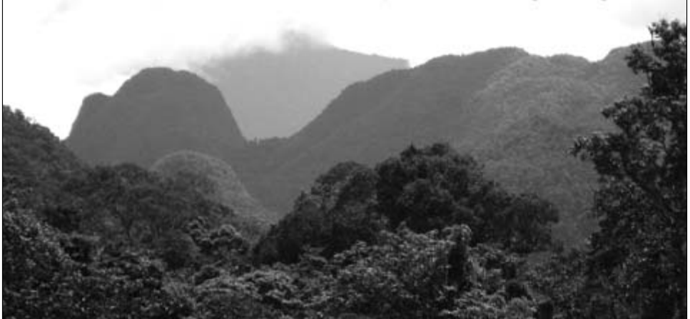
Reich der Träume: Primärregenwald auf Borneo – die Vision von gebundenem Kohlenstoff und biologischer Vielfalt

Und leise hörten sie die Erde aufatmen und wussten, dass sie auf einem guten Weg waren.